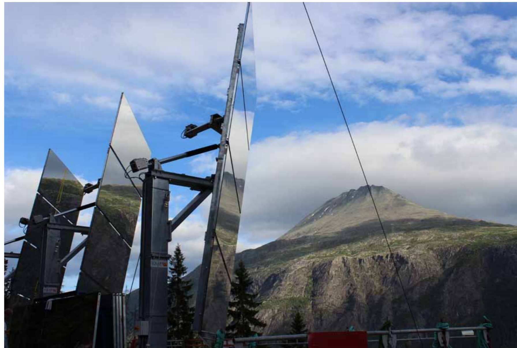
THE SUN MIRROR. PHOTO: KARL MARTIN JAKOBSEN

I februar 2007 fikk jeg en mystisk liten melding på nettstedet Underskog. Den var fra noen som kalte seg «sabotørene», og de ba meg kikke på adressen themirrorproject.org . Nettsiden var et ganske hjelpeløst forsøk på å være smart og halvfancy, et par ikke-klikkbare flash-animasjoner, en strek og noen bølger. Om dette var et forsøk på sabotasje, så funka det ikke. Et lett irritert museklikk senere var jeg i ferd med å se på noe annet og sikkert mye mer spennende. Det jeg ikke visste da, var at jeg seks år senere skulle stå på torget i et høstmørkt Rjukan med solstråler fra tre gedigne heliostatiske speil i ansiktet.