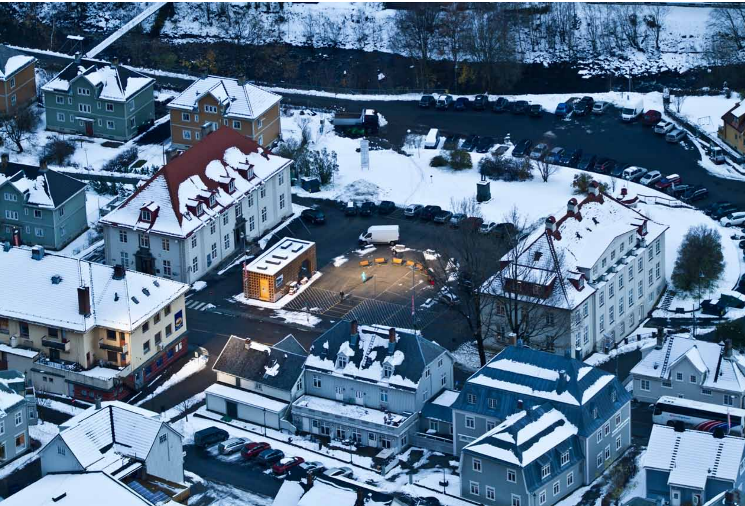
WINTER SUN ON RJUKANS MARKET SQUARE FOR THE FIRST TIME.